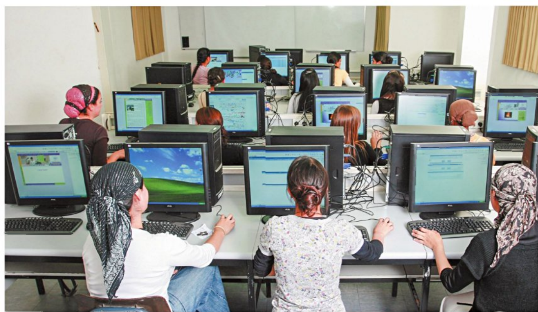
מכללת 'חמדת הדרום'

המכללות הדתיות, שנהנו מאוטונומיה אקדמית, נדרשות להתאחד ביניהן ולעבור לאחריות המל"ג. המטרה מבורכת: יותר כסף ומסלולי לימוד חדשים, אך ראשי המכללות חוששים כי השינוי יוביל להתערבות בתכנים ובצביון הדתי, ומנסים לעגן את זכויותיהם בחקיקה ראשונה מסוגה