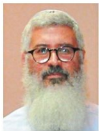
פרופ' לוי