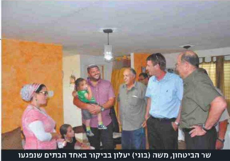
שר הביטחון, משה (בוגי) יעלון בביקור באחד הבתים שנפגעו