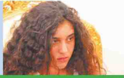
"תנו לגדול בשקט"

אנשי סגל ואנשי מנהלה במכללה, לומדים ועובדים ללא פתרון ביטחוני הולם. יש לטפל בבעיה בהקדם ולשנות לאלתר את התקנות הארכאיות והבעייתיות בע"ניין המיגון, בטרם תיגרם פגיעה בגוף או בנפש."