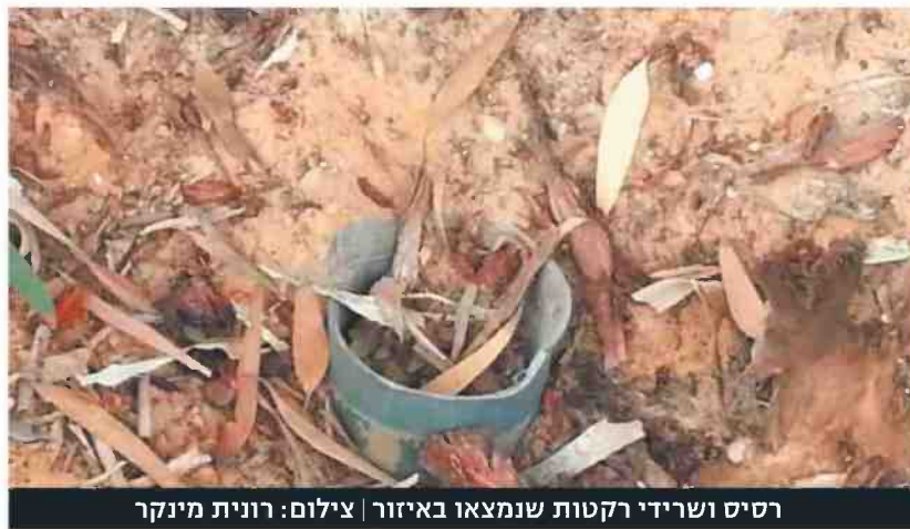
רסיס ושרידי רקטות שנמצאו באזור