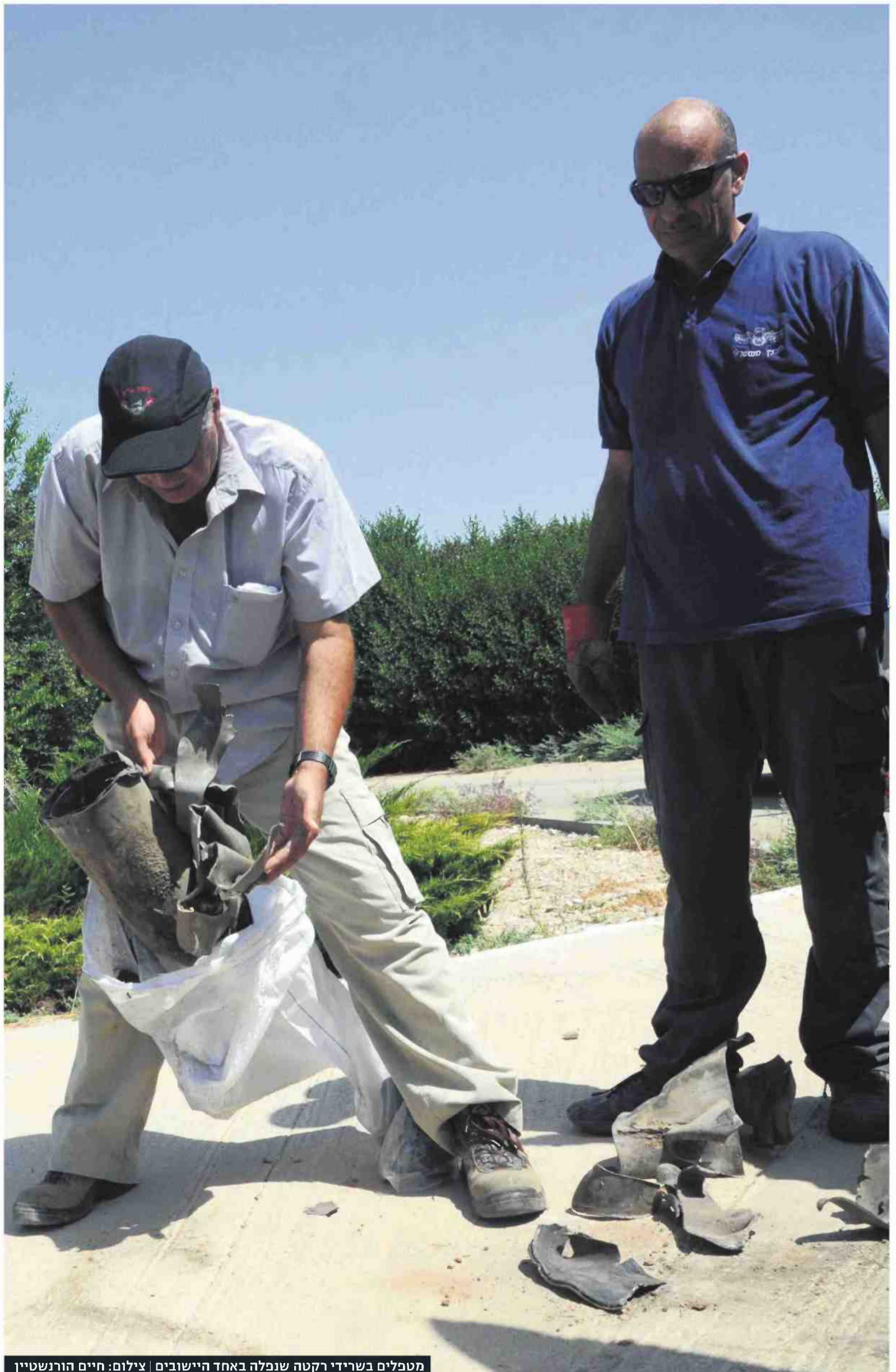
מטפלים בשרידי רקטה שנפלה באחד היישובים