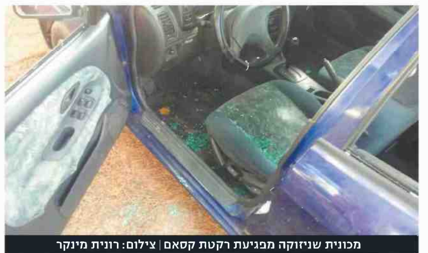
מכונית שניזוקה מפגיעת רקטת קסאם

נכון ליום רביעי המתיחות ניכרת באזור עוטף עזה, אם כי, כאמור, התושבים כבר