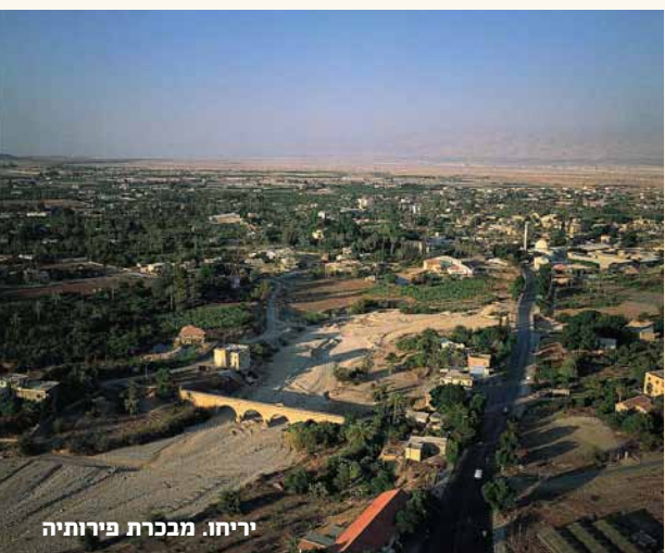
יריחו. מבכרת פירוטיה

הקטן שבשבטים, המרכזי בנחלות, זכה לשכינה, לגבורה ולמנהיגות. הצבר, היתום מאם מיום הולדתו היה לגשר בין יהודה לישראל.